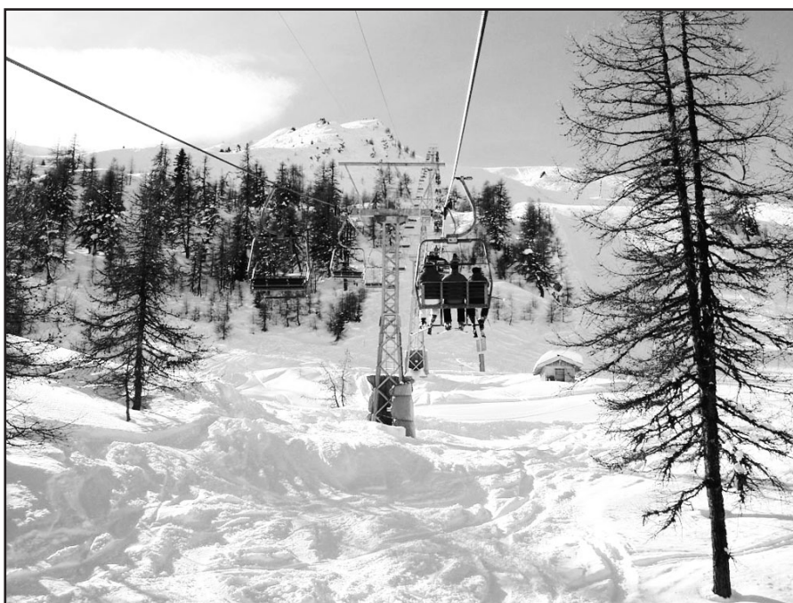
Le télésiège de La Pasay jouera un rôle central dans le futur développement du domaine skiable de Bruson.

Parallèlement à la construction de la télécabine, prévue entre 2009 et 2010, Téléverbier va ainsi doter une bonne partie du domaine de l'enneigement mécanique: «Les pistes principales seront enneigées jusqu'à la station intermédiaire (La Côt) de la future télécabine. Nous disposons notamment d'une belle piste FIS homologuée qui pourra accueillir des compétitions nationales et internationales. Pour ce faire, un lac de retenue de 15 000 m 3 sera aménagé au lieu dit Moneyeu.»